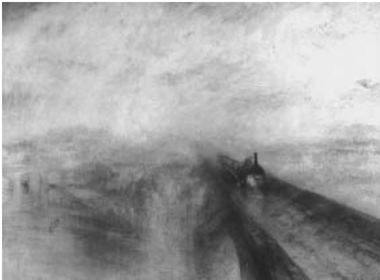
ターナー「雨・蒸気・速力」 1844 91×122cm

『色彩論』のドイツでの出版は、一八一〇年であるが英訳本の刊行は偶然なのだろうが一八四〇年である。ということは一八四〇年以前に彼は英訳では色彩論を読んでいないことになる。いずれにせよ、ゲーテの『色彩論』が色彩表現を追及しようとするターナーを強く後押ししたことに疑いはない。重要な点はそれが一八四〇年以