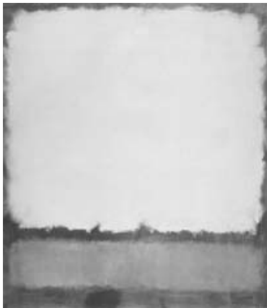
マーク・ロスコ「Orange, Red and Red」 1962 236 x 203cm MARK ROTHKO 1903 - 1970 The Tate Gallery 1987より

は無彩色に還元され黒、グレー、茶による二色対比が試みられる。かと思えば、突然明度の高いピンク、あるいはグレーの、またはきわめてコントラストの強い青地に黒、そしてさらには五〇年代のオレンジと赤、と、いうようにその様相は、振幅が大きいというよりいわば混乱そのものように映り、その全ての作品に輝きを私は感じる事ができない。むしろ、作家の苦悶、悶えを感じてしまうのである。