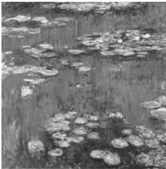
モネ「睡蓮」 1914 200×200cm

Claude Monet Karin Sagner - DÜCHTING, TASCHEN, 2001より