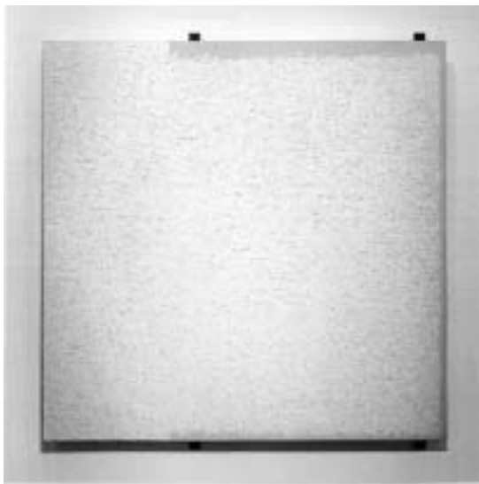
ロバート・ライマン「Assistant」 1990 279.4×266.7cm ロバート・ライマン展 川村記念美術館，2004より

社の企業名からの命名というところになっている。正式名は「Winser & Newton」で日本では一般に「ニュートン」と呼ばれているが、アメリカでは「Winser」と呼ばれるのである。これにせよ日本においては「Winser」は絵具会社のコンテションを持たないが、問題はそれにあるのではなく、この絵がWinser社の白絵具で描かれ、「Winser」という名を持ったこと、つまりその白は「Winser」の白であるという点なのである。