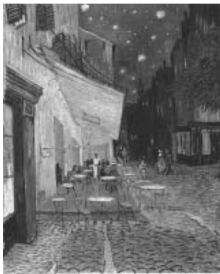
ゴッホ「夜のカフェテラス」 1880 80.7×65.3cm ゴッホ展 東京国立近代美術館,2005より

このことはゴッホの作品を白黒の図版、写真で見ると容易に納得できるはずである。ゴッホの画面において、適正な明度値（ヴァールル）を持っているそれらの色は、そのそれぞれの色がグレーに還元される際、奪われてしまったそれぞれの色相と高い視認度を、再び身につけ、再生させられたのであると考えられないだろうか。ゴッホという天才は、彼の主観が直感としてそれぞれの色を選びわけ、強い筆触を残しながら形象と彼の精神を描きこんでいったの