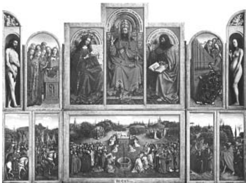
ファン・アイク「仔羊の祭壇画」 1432 375×520cm VAN EYCK Langewiesche Königstein, 1980より

ファン・アイクとティツィアーノの色彩表現におけるこの両者の差異に見られるように、外殼的立体表現に際して、画面上で統合を計ろうとする色彩とかたちを分極性の概念で捉えることによって、色彩はその特質を詳らかにするのである。