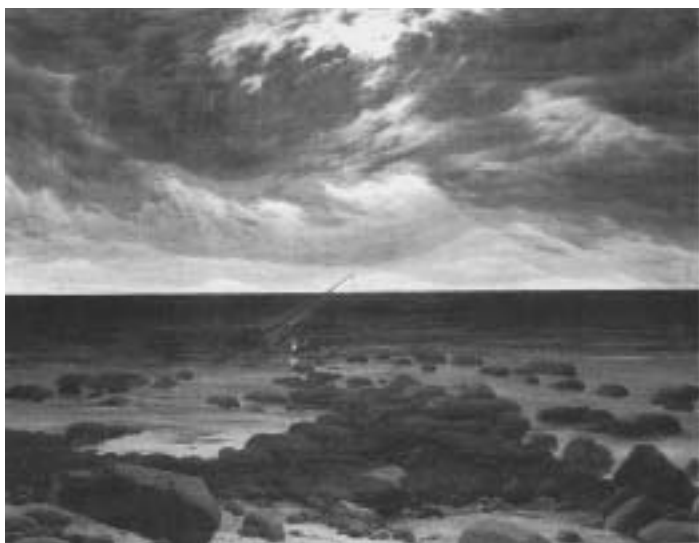
フリードリッヒ「Meeresküste bei Mondschein」 1830 77×97cm C.D.Friedrich National galerie Berlin, 1985より

クロノジカルに編集してあった画集を時間軸に沿って、生き生きと輝くその色彩の一点一点を丁寧に追いかけていたそのとき、突如目で送るページから、輝きが消えうせてしまったかのように感じられたのだった。カラーページのその図版に輝きがない。私はそのページを送りながらロスコが死に引き込まれていってしまったように思えたのだった。私は今でもロスコの自殺と彼の色彩の本質とを切り離すことはできない。